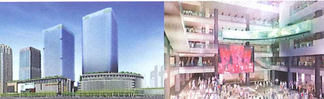
大阪駅北地区開発計画